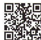
応募フォームのQRコード

※ご応募頂いた個人情報、本事業に関する調査のために使用し、他の目的で使用することはございません。